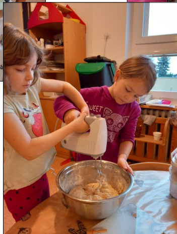
MŠ Milín – masopust