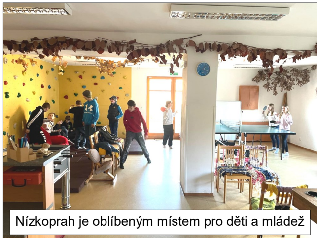
Nízkoprah je oblíbeným místem pro děti a mládež

Poprvé měl v budově CVA sídlo volební okrsek. Okrsek č. 2 býval dříve v budově radnice a z důvodu přestěhování pobočky pošty bylo rozhodnuto o umístění okrsku do budovy knihovny. Vstup je bezbariérový a pro potřeby voleb je i dostatek vhodného prostoru. Jedna z knihovnic byla zapisovatelkou komise.