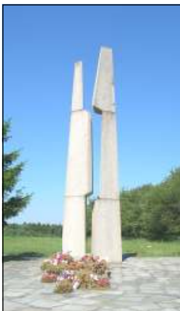
Památník 2. sv. války