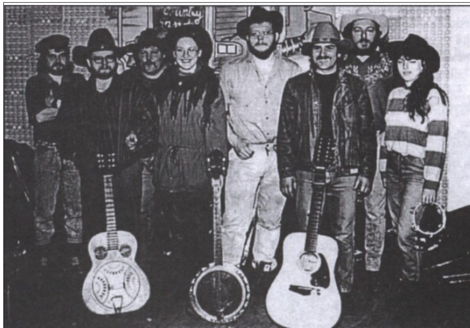
Country band - na následující straně text