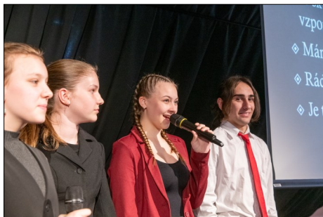
Příběhy našich sousedů