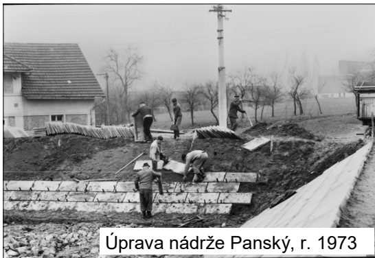
Úprava nádrže Panský, r. 1973

Promítání fotek – díky další várce černobílých (papírových) fotek, které dodal J. Fuka a k promítání do digitální podoby přefotil M. Kunt, jsme se přenesli do Milína minulého století, respektive do 70. - 90. let. Snímky nám odkryly, co a jak probíhalo při výstavbě nádrže Panský, areálu mateřské školy, milínských ulic, obchvatu Milína (silnice R4), stavbě sila. Při prohlížení jsme se nejen kochali a vzpomínali, ale odvedli i kus dokumentární práce. K fotkám jsme přidali „odpovídající“ popisky, doplnili jména.