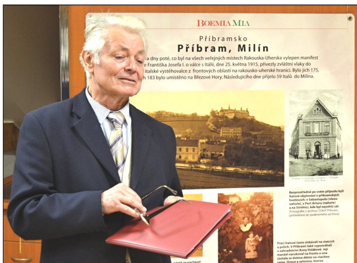
Foto z r. 2017 - zahájení výstavy Boemia mia v místní knihovně

Od r. 2011 je Zpravodaj zveřejňován v elektronické podobě na www.milin.cz